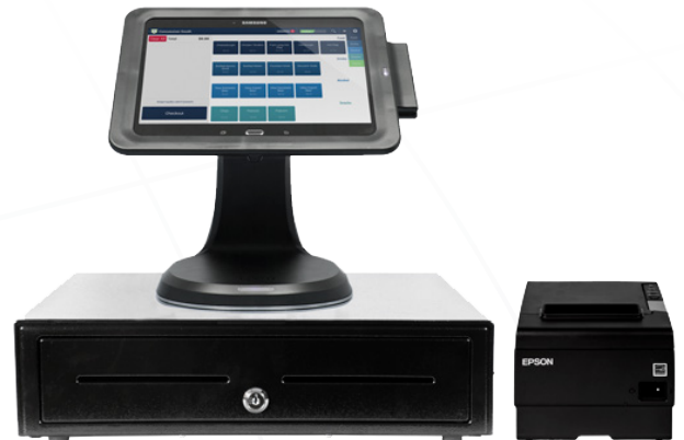
Transformez vos tablettes en caisse enregistreuse