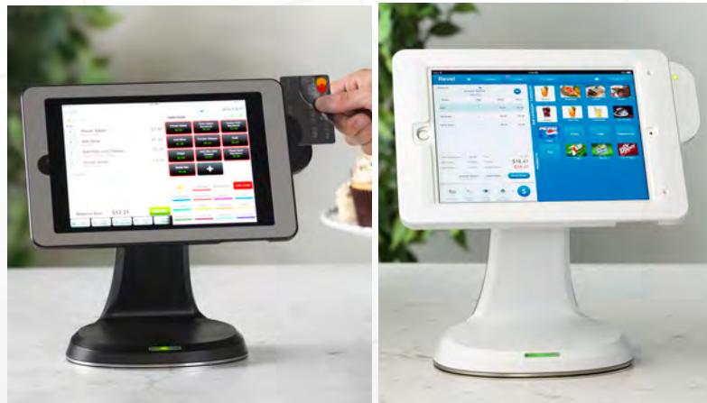
Transforme les tablettes en postes de travail entièrement fonctionnels