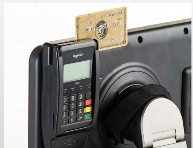
Accessoire possible : terminal de paiement Ingenico

>> En savoir plus sur la solution tablette nomade <<