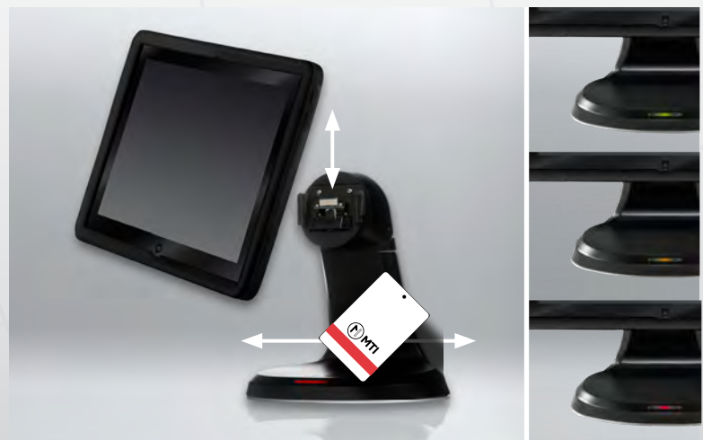
La carte RFID glisse sur la base pour libérer la partie mobile

>> En savoir plus sur la solution tablette nomade <<