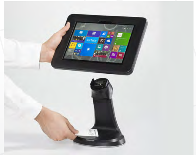
Se déverrouille rapidement pour plus de mobilité