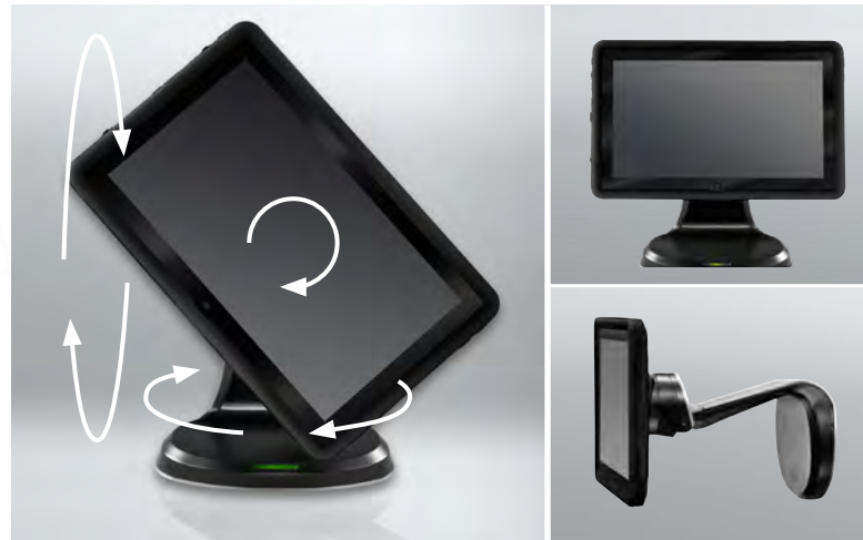
Plusieurs inclinaisons et rotations possibles