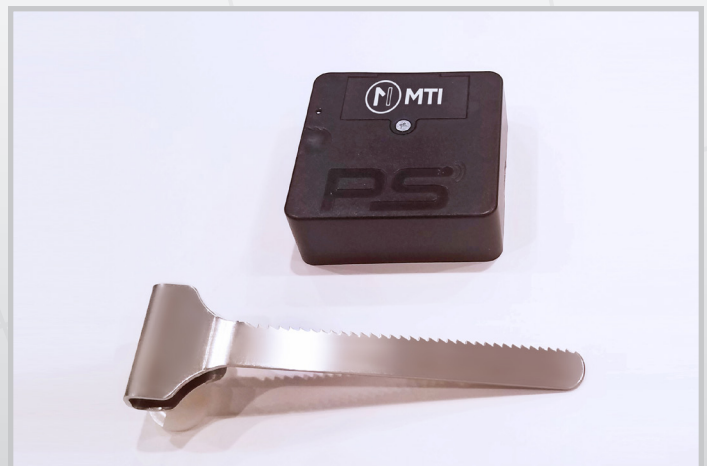
Kit pour vitrine en verre