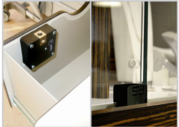
Installation des serrures dans des meubles, sur des vitrines, ..