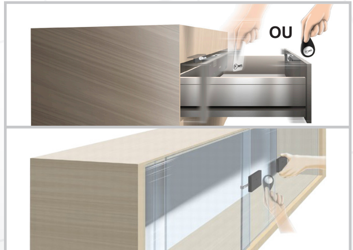
Ouverture via la technologie RFID